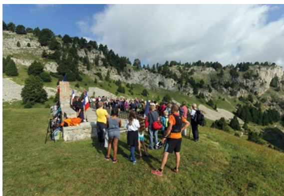
Nécropole du Pas de l'Aiguille.

Présents sur la totalité du territoire national, les nécropoles nationales et les hauts lieux de la mémoire nationale sont une porte d'entrée à l'éducation citoyenne. Un accueil personnalisé sur ces sites permet de mettre en lumière, à travers les parcours de combattants ou victimes civiles, l'histoire nationale et locale ainsi que l'histoire du site.