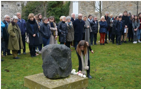
Cérémonie d'hommage aux Justes, 20 janvier 2020, Le Chambon-sur-Lignon.

Dans ce cadre, le volontaire pourra être amené à concevoir une cérémonie, par exemple à l'occasion de la Journée internationale de la mémoire des victimes de la Shoah et de la prévention des crimes contre l'humanité. Il définira son programme et participera à l'implication de scolaires, ainsi qu'au travail pédagogique mené en amont pour une meilleure appropriation par le public des faits et des enjeux de la commémoration.