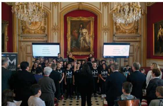
Cérémonie de remise des trophées « Héritiers de la mémoire », mai 2018.

Le ministère des armées propose de nombreuses actions d'enseignement de défense visant à mieux faire connaître ses missions, son histoire et son patrimoine. Il organise ou participe aussi à de nombreuses manifestations mémorielles de portée nationale à destination de la jeunesse. Parmi celles-ci