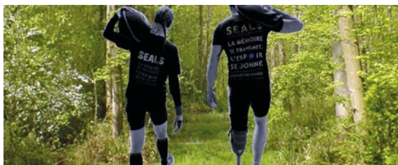
Course du Bleuets, septembre 2018.

Le volontaire, en lien avec une association du monde combattant ou le service de l'ONAC-VG de son département, organisera une rencontre sportive de son choix (match de football, rugby, course...). Cet événement sera l'occasion de faire porter le Bleuets de France par les participants.