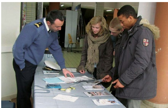
9 e rencontre Défense - Éducation nationale dans le Nord, avril 2013.

Les trinômes académiques regroupent dans chaque académie l'ensemble des acteurs de l'esprit de défense. Ils ont pour vocation de concevoir les activités concourant au développement de la culture de défense. A ce titre, ils contribuent à l'organisation de formations à destination de