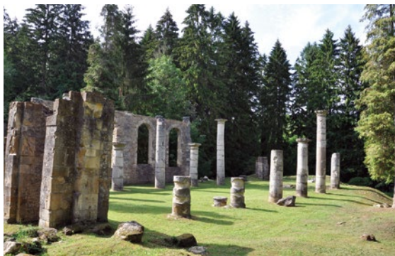
Ornes, vestiges de l'église : une valeur symbolique des « sacrifiés pour Verdun », 2018.