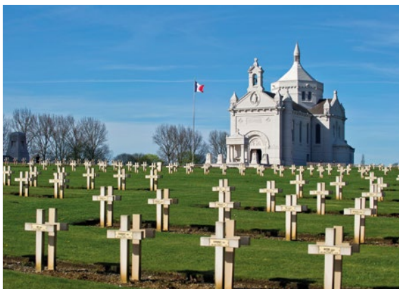
Notre-Dame de Lorette.

Présentes sur la totalité du territoire national, les nécropoles nationales sont une porte d'entrée à l'éducation citoyenne. Elles permettent en effet d'appréhender les symboles et valeurs de la République et d'approfondir les phases historiques des combats et batailles en lien avec ces lieux.