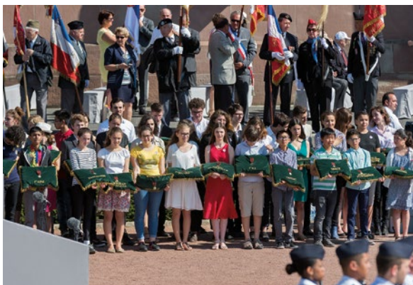
Cérémonie commémorative de l'appel historique du général de Gaulle, 18 juin 2017.

Chaque année, le ministère des armées organise des cérémonies publiques commémoratives, appelées « journées nationales », qui sont l'expression de la reconnaissance de la Nation envers ceux qui ont combattu et qui ont souffert pour défendre les valeurs républicaines et humanistes