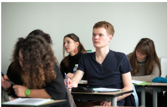
Formation de futurs enseignants en École supérieure du professorat et de l'éducation (ESPE).

Les trinômes académiques regroupent dans chaque académie l'ensemble des acteurs de l'esprit de défense. Ils ont pour vocation de concevoir les activités concourant au développement de la culture de défense. Les trinômes participent à la formation initiale et continue des enseignants lors de colloques ou d'ateliers.