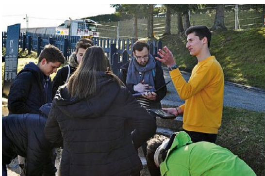
Élève guide, camp de Natzweiler-Struthof, mars 2019.

Il pourra participer aux temps forts annuels (cérémonie, Journées européennes du Patrimoine, inauguration d'exposition...) et apporter un soutien aux actions de médiation lors de séquences adaptées à travers des visites guidées et ateliers pédagogiques.