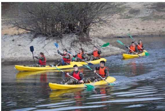
Rallye citoyen du camp de Souge, avril 2017.

Les trinômes académiques regroupent dans chaque académie l'ensemble des acteurs de l'esprit de défense. Ils ont pour vocation de concevoir les activités concourant au développement de la culture de défense. Ces activités sont variées et comprennent notamment des rallyes